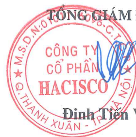
Đinh Tiên Vịnh